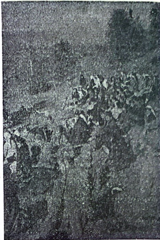
Група бораца и народ слуша певање гуслара у Брезницама 1943.