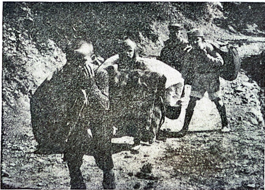
Деца се склањају пред зулумом непријатеља

су спалили села Мокро и Градац, а потом у Шавнику оно кућа што је још остало после ранијих бомбардовања. Ове колоне које су наступале према Шавнику убијале су одреда све оне које су похватале. Но, како се народ већ био склонио у збегове по тешко приступачним кањонима Комарнице и у планини Војнику, Немци су затекли и поубијали по селима око Шавника свега око 15 људи и жена, махом старих и болесних које су затекли по кућама и око њих. Међу овима било је свега неколико млађих људи који су се, као веза или извиђачи збегова, пребацивали с једног места на друго и тако изненадно упадали у немачке заседе или се неочекивано сусретали с њиховим патролама. И њих су убили на лицу места.