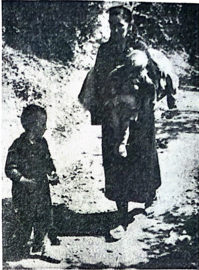
У збегу за време операције „Рибецал” 1944.

шавали на све начине да се докопају збегова и да их униште, па су се размилили по читавом овом терену, користећи и лажна обећања да се онима који се сами врате кућама неће ништа догодити.