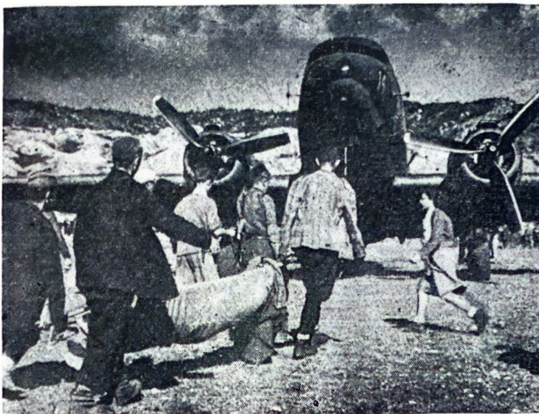
Евакуација рањеника с Брезана за Италију, 22 августа 1944

већ познате „дакоте”. Све је оживело. Сигнали су измењани и веза убрзо успостављена. Ловци су брзо ућуткали немачку артиљерију и митраљезе, а „дакоте” се релативно лако спустиле на нови партизански аеродром. Настаде радост и стисак руку ратних другова и брзи утовар рањеника. Британски авијатичари су саопштили да један авион може примити само 24 рањеника и болесника. Међутим, није било могуће одржати дисциплину. Укрцавано их је и по тридесет и више 224 . Британски авијатичари су то са разумевањем толерисали. Иако се није држало прописаног броја, оптерећење по тежини није прекорачено, јер многи болесници и рањеници нису прелазили ни 50 килограма. Сем тога, све без чега се могло одбацивано је: штаке, штапови, обућа. На брезанској утрини остало је тог дана много до-