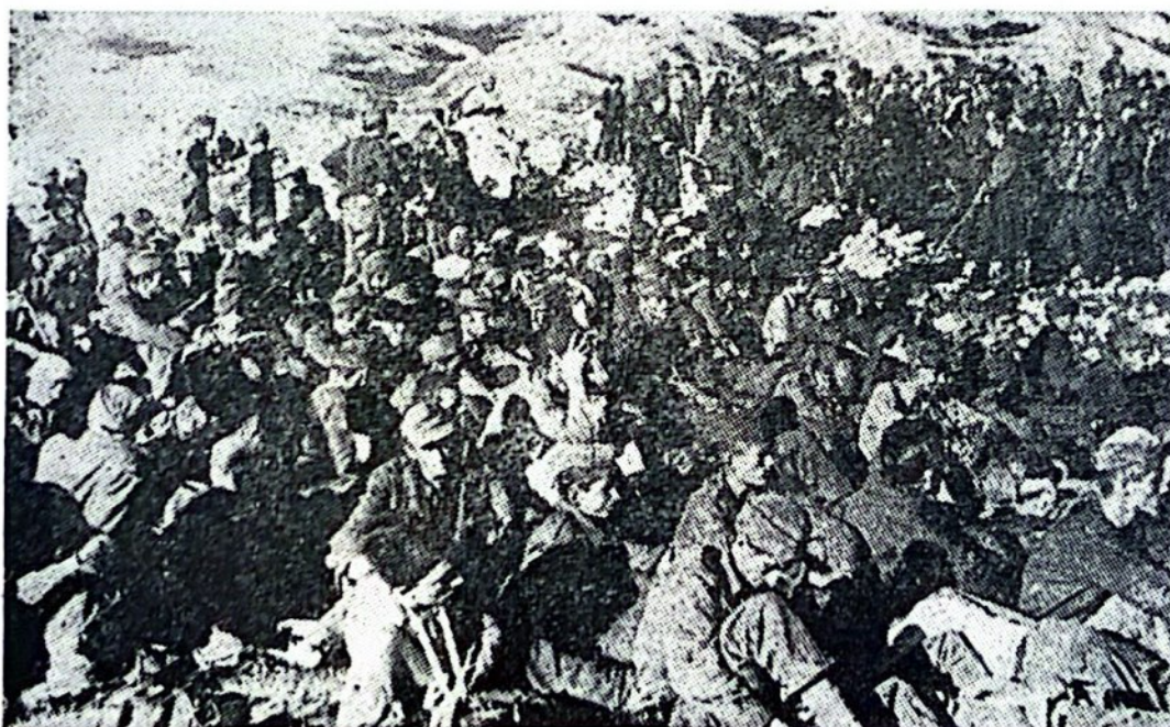
Рањеници у Брезнама у очекивању авиона за евакуацију за Италију 21. августа 1944.